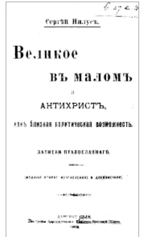
Titulná strana knihy Velikoe v malom i Antikrist (1905) od Sergeja Nilusa, v ktorej boli publikované Protokoly sionských mudrcov .

Obavy zo židovského celosvetového sprisahania vyvrcholili v Protokoloch sionských mudrcov , podvrhu zverejneného v ruskej tlači v roku 1903, ktorý mal byť autentickým záznamom z Prvého sionistického kongresu konaného v Bazileji v roku 1897. Po prvýkrát sa informácia o nich objavila v Petrohrade v časopise Znamja v článku „Programa zavojevanija mira jevrejami“ [Program Židov na ovládnutie sveta]. V plnom znení ich publikoval v roku 1905 Sergej Nilus (1862-1929) v poslednej kapitole svojej knihy Velikoe v malom i antikrist, kak blizkaja političeskaja vozmožnost. Zapiski pravoslavnogo [Veľké v malom a Antikrist ako blízka politická možnosť. Zápisky pravoslávneho] (obr. 1). V skutočnosti šlo o podvrh, ktorý bol podľa dostupných informácií vypracovaný ruskou tajnou službou s použitím iného pamfletu – zakázaného spisu M. Jolyho ( Dialogues aux Enfers entre Montesquieu et Miachavel ) namiereného proti Napoleonovi III. 84 Protokoly obsiahlo pomenúvajú stratégie, akými sprisahané židovské mocenské centrum riadi medzinárodnú politiku, hospodárstvo a médiá tak, aby si ich nebadane podmanili a zotročili. Spis je vlastne obžalobou spôsobu fungovania moderného sveta, ktorý