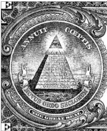
Domnelé symboly rádu iluminátov na jednodlárovej bankovke: neukončená pyramída, na jej spodnej vrstve rok 1776 (rok vyhlásenia nezávislosti, ale aj vzniku rádu Iluminátov v Bavorsku), nápis Novus Ordo Sec(u)lorum [Nový svetový poriadok]. Oko v trojuholníku údajne nie je symbolom Trojjediného Boha kresťanov, ale ezoterický gnostický iluminátov (Bröckers 2002: 48).